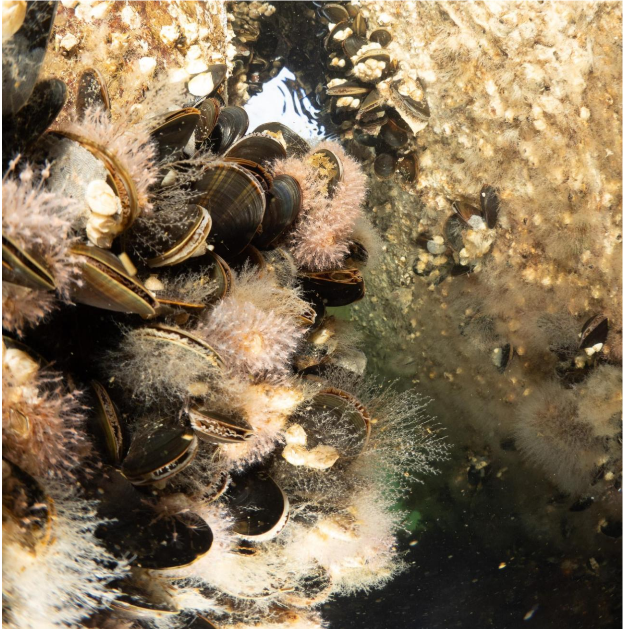
Figur 15 – Tætte forekomster af blåmuslinger, rurer og forskellige arter af hydroider ved stensætningen ved Station 5 ved Trekroner Søfort. Taget på 1-2 meters dybde.