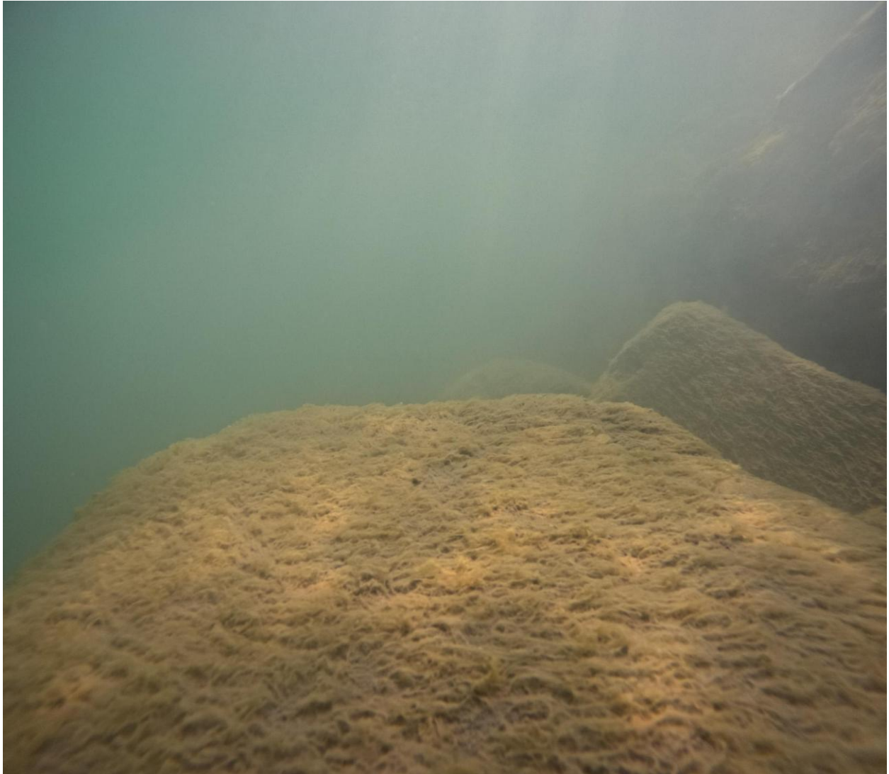
Figur 6 - Nylagte sten ved Station 2 ved Fase 2. Stenene er dækket af for nyligt koloniserede opportunistiske fedtemøgsagtige alger – taget på 2-3 meters dybde.