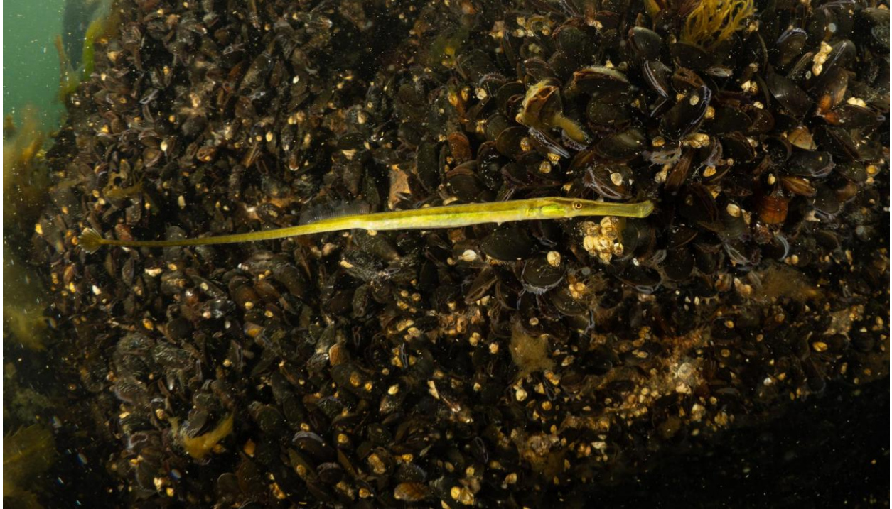
Figur 8 – Lille tangnål og tæt dække af blåmuslinger og rurer på stensætningen ved Station 3 ved Fase 1. Taget på 3 meters dybde.