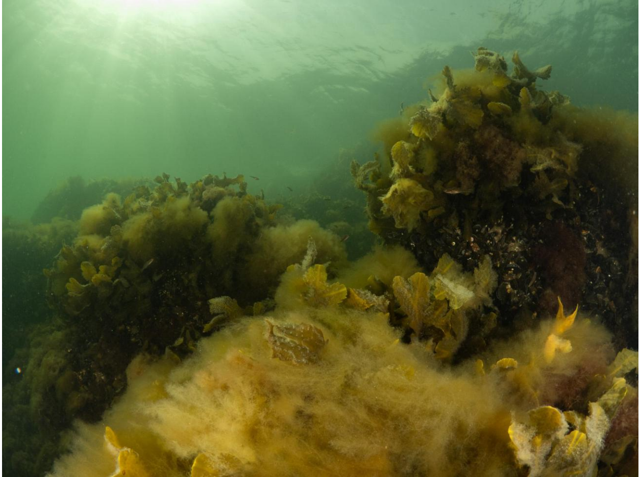
Figur 9 – Savtang og blåmuslinger dækket af opportunistiske fedtemøgsalger ved Station 3 ved Fase 1. I baggrunden ses enkelte individer af toplettet kutling. Taget på 4-5 meters dybde.