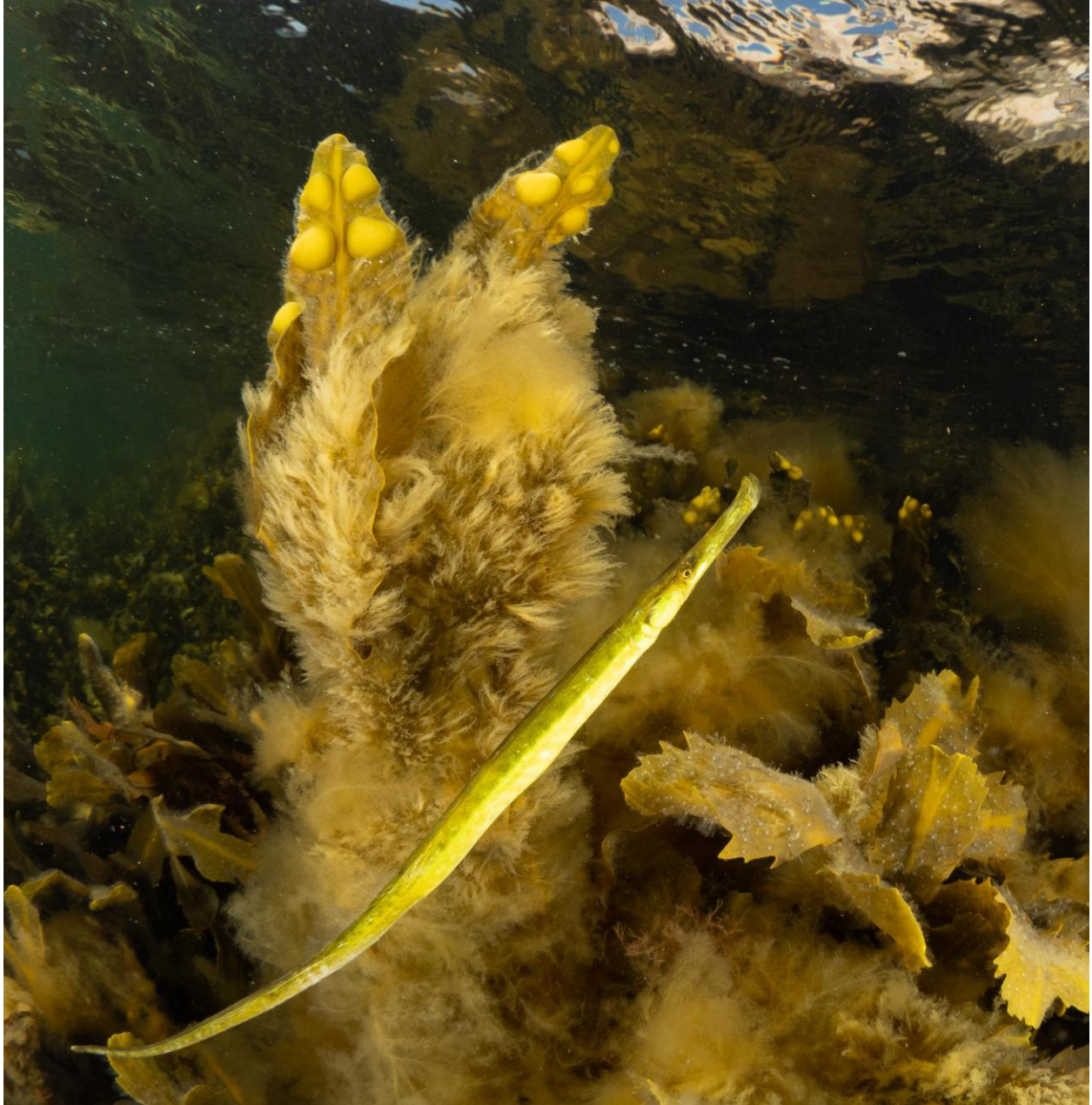
Figur 11 - Lille tangnål blandt sav- og blæretang dækket af opportunistiske fedtemøgsalger ved Station 4 ved Fase 1. De små hvide "prikker" på savtangen er cryptostomata, der indeholder slimhår. Slimhårene er med til at holde tangplanten fugtig under potentiel udtørring. Taget på 0-1 meters dybde.