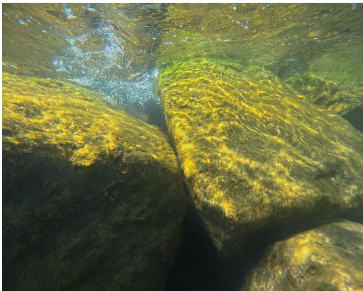
Figur 5 – Nylagte sten ved station 2 ved Fase 2. Stenene er dækket af for nyligt koloniserede opportunistiske grønalger, formentlig rørhinde sp. og fedtemøgsagtige alger – taget på 0-1 meters dybde.

På grund af dårlig sigt og strøm blev der kun dykket fra 0-3 meter.