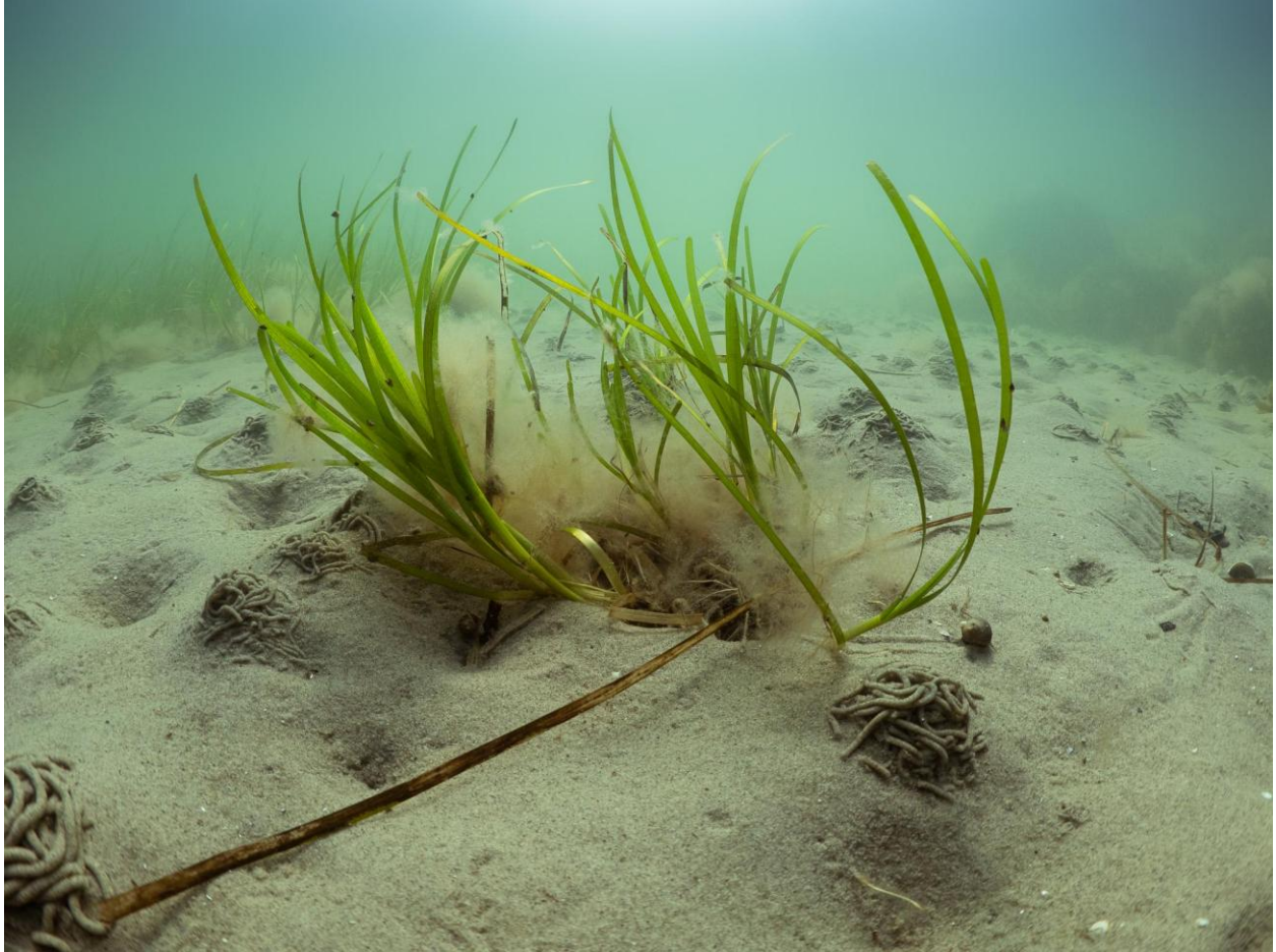
Figur 23 Ålegræs med dyndsnegle og fedtemøg ved Station 7, havbunden mellem Lynetteholms vestlige perimeter og Søfortet Trekroner. På havbunden ses spor efter havbørsteorme.