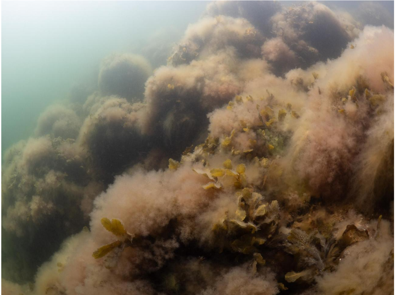
Figur 17 – Tæt dække af fedtemøgسالger på savtang ved Station 5 ved Tre Kroner Søfort. Taget på 5 meters dybde.