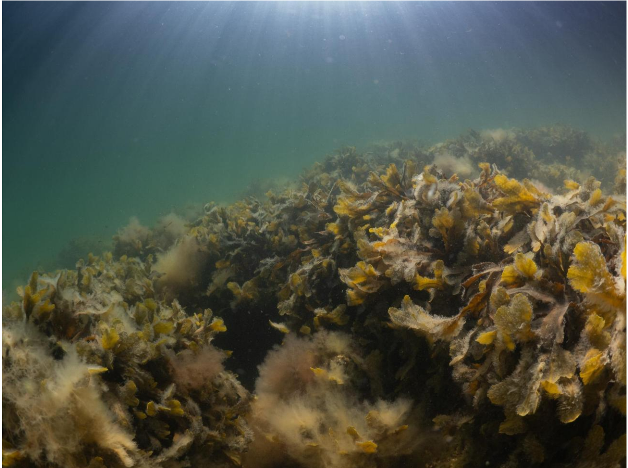
Figur 19 – Savtang dækket af spredte fedtemøgsalger ved Station 6 ved Søfortet Trekroner. De små korte hvide "hår" på savtangen er slimhår i cryptostomata. Taget på 3 meters dybde.