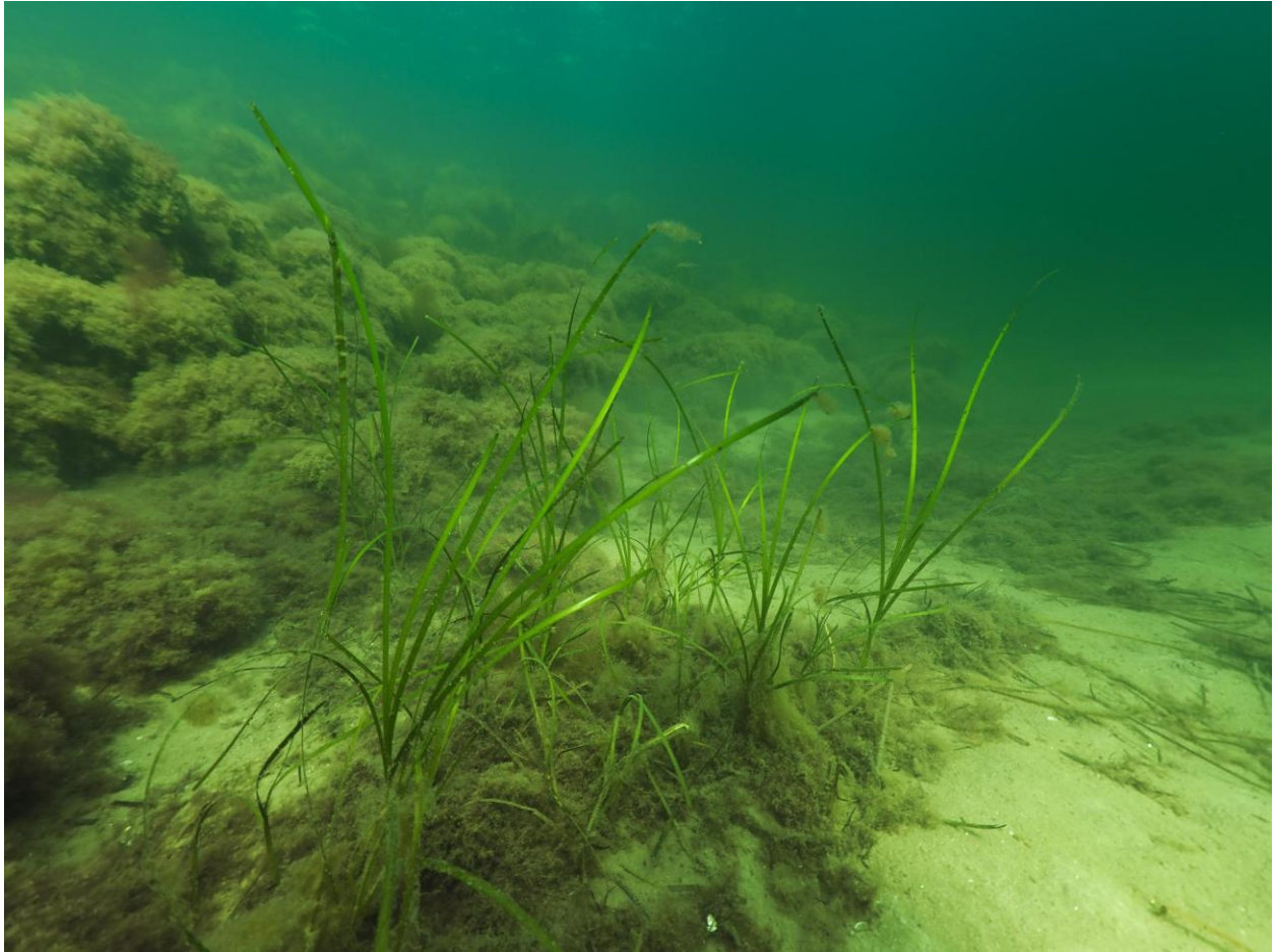
Figur 13 – Spredte forekomster af ålegræs på kanten af stensætningen ved havbunden ved Station 4 ved Fase 1. De enkelte ålegræsstrå er ikke dækket af fedtemøg, der dog dækker store dele af stensætningen og forekommer på havbunden. Taget på cirka 7 meters dybde.