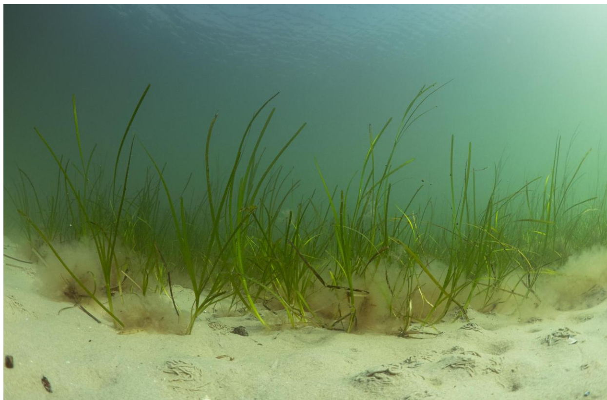
Figur 21 – Ålegræs med dyndsnegle og fedtemøg ved Station 7, havbunden mellem Lynetteholms vestlige perimeter og Søfortet Trekroner. På havbunden ses spor efter havbørsteorm.

I alt blev der set 19 arter på Station 7.