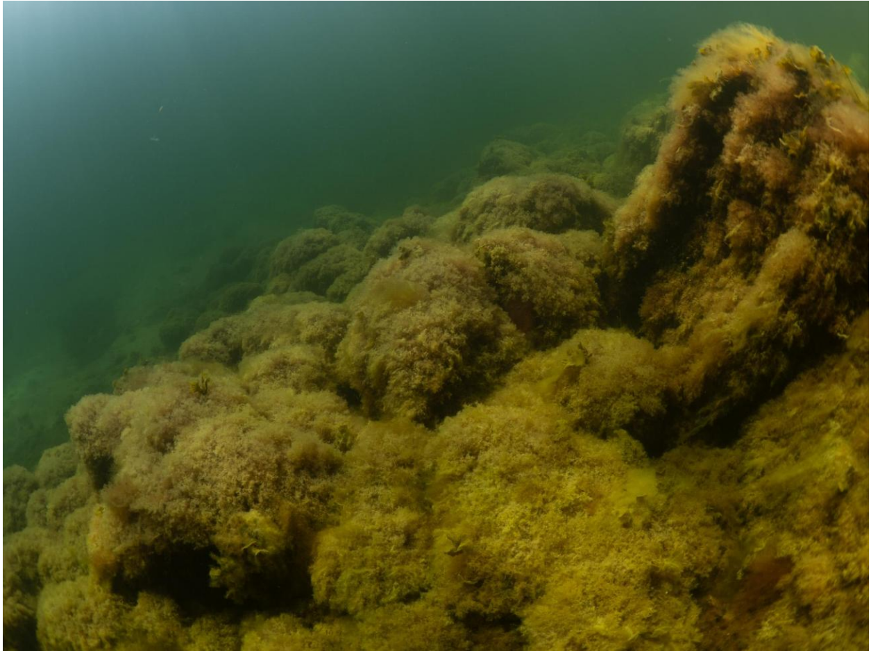
Figur 12 – Næsten 100 % dække af opportunistiske fedtemøgssalger på savtang og blåmuslinger på 5 meters dybde ved Station 4 ved Fase 1.