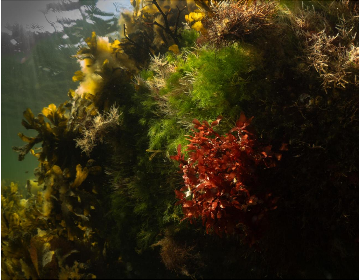
Figur 20 – Carrageentang, grønalg, gaffeltang og hydroider i dække af sav- og blæretang ved Station 6 ved Søfortet Trekroner. I baggrunden ses spredte forekomster af fedtemøg. Taget på 1-2 meters dybde.