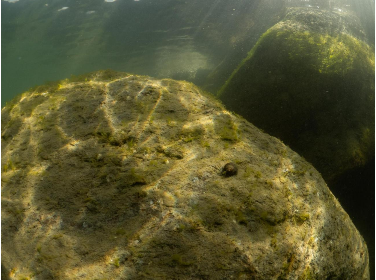
Figur 4 - Nylagt sten ved Station 1 ved Fase 2. Stenen er dækket af for nyligt koloniserede opportunistiske grønalg, formentlig rørhinde sp, samt enkelte individer af almindelig strandsnegl. Taget på 1-2 meters dybde.