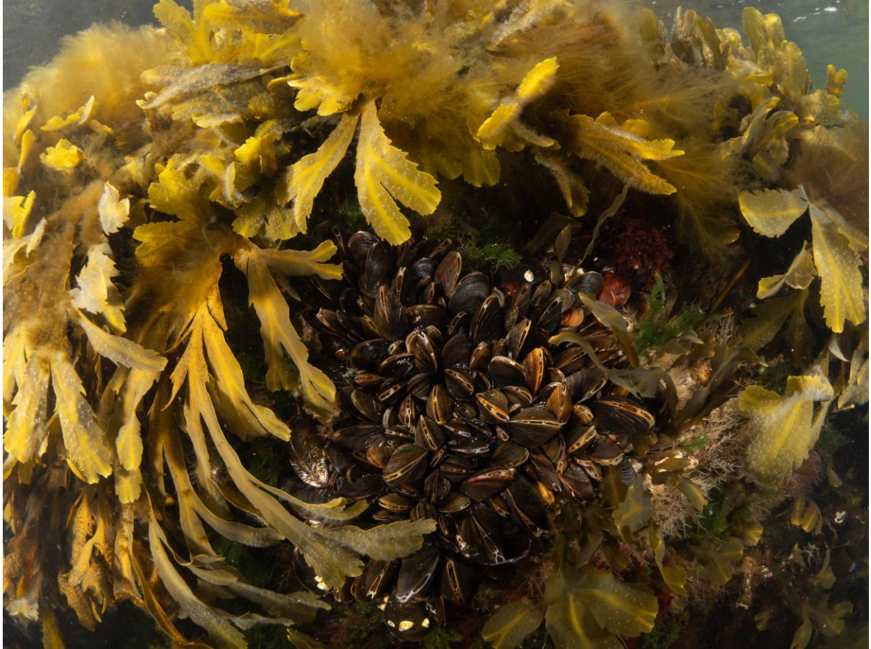
Figur 14 – Savtang med cryptostomata dækket af fedtemøg ved Station 5 ved Trekrøner Søfort. Under savtangen ses høje tætheder af blåmuslinger og enkelte hydroider, grønalger og potentielt rødalgen carrageentang. Taget på 0-1 meters dybde.