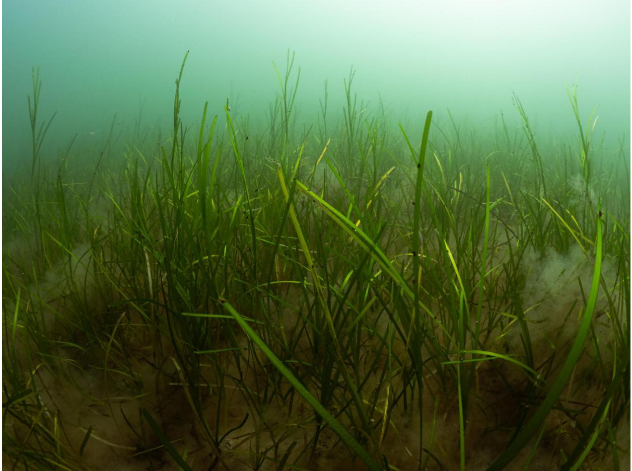
Figur 22 - Ålegræs med dyndsnegle og fedtemøg ved Station 7, havbunden mellem Lynetteholms vestlige perimeter og Søfortet Trekroner.