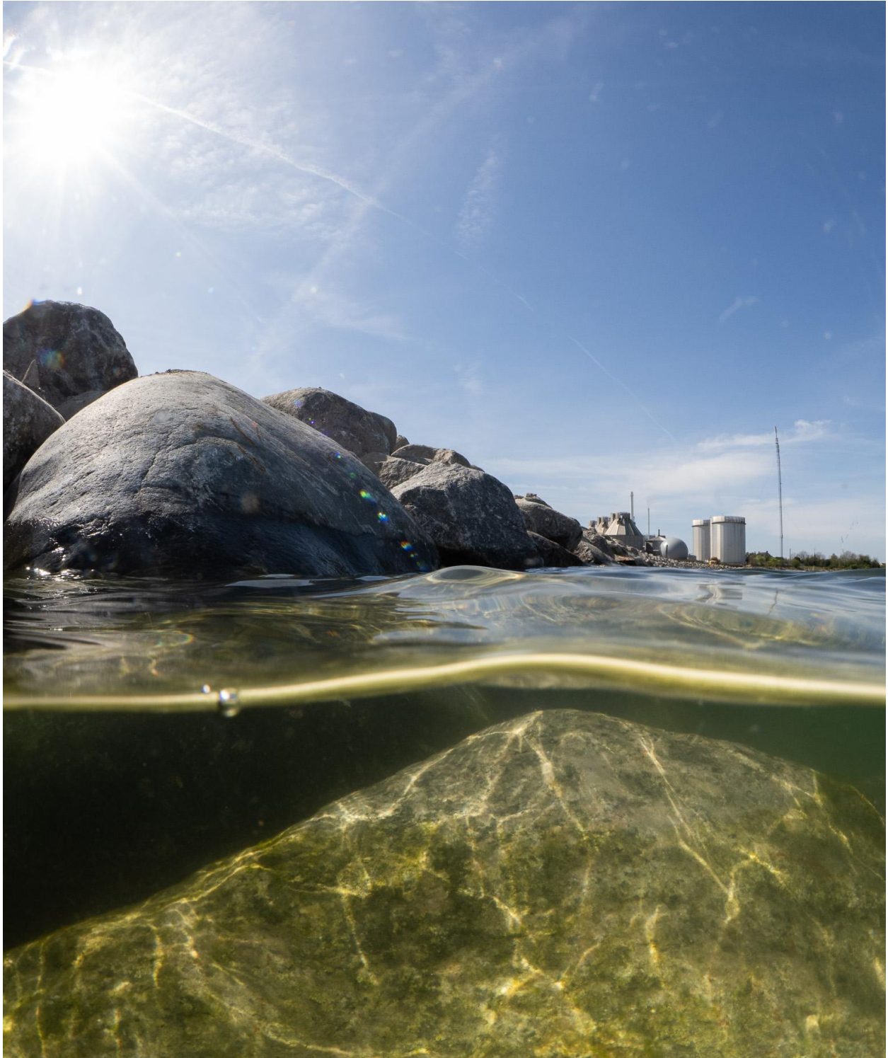
Figur 3 - Nylagt sten ved Station 1 ved Fase 2. Stenen er dækket af for nyligt koloniserede grønalger, formentlig arten rørhinde. Taget på 0-1 meters dybde.