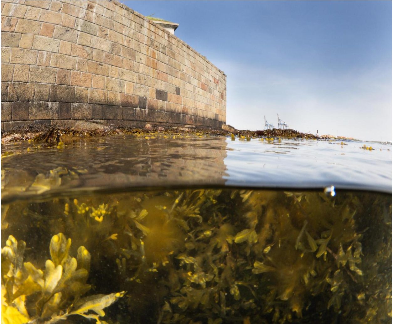
Figur 18 – Blæretang dækket af fedtemøg i tidevandszonen ved Station 6 ved Søfortet Trekroner. På stenene over vandoverfladen ses enkelte rurer. Taget på 0-1 meters dybde.