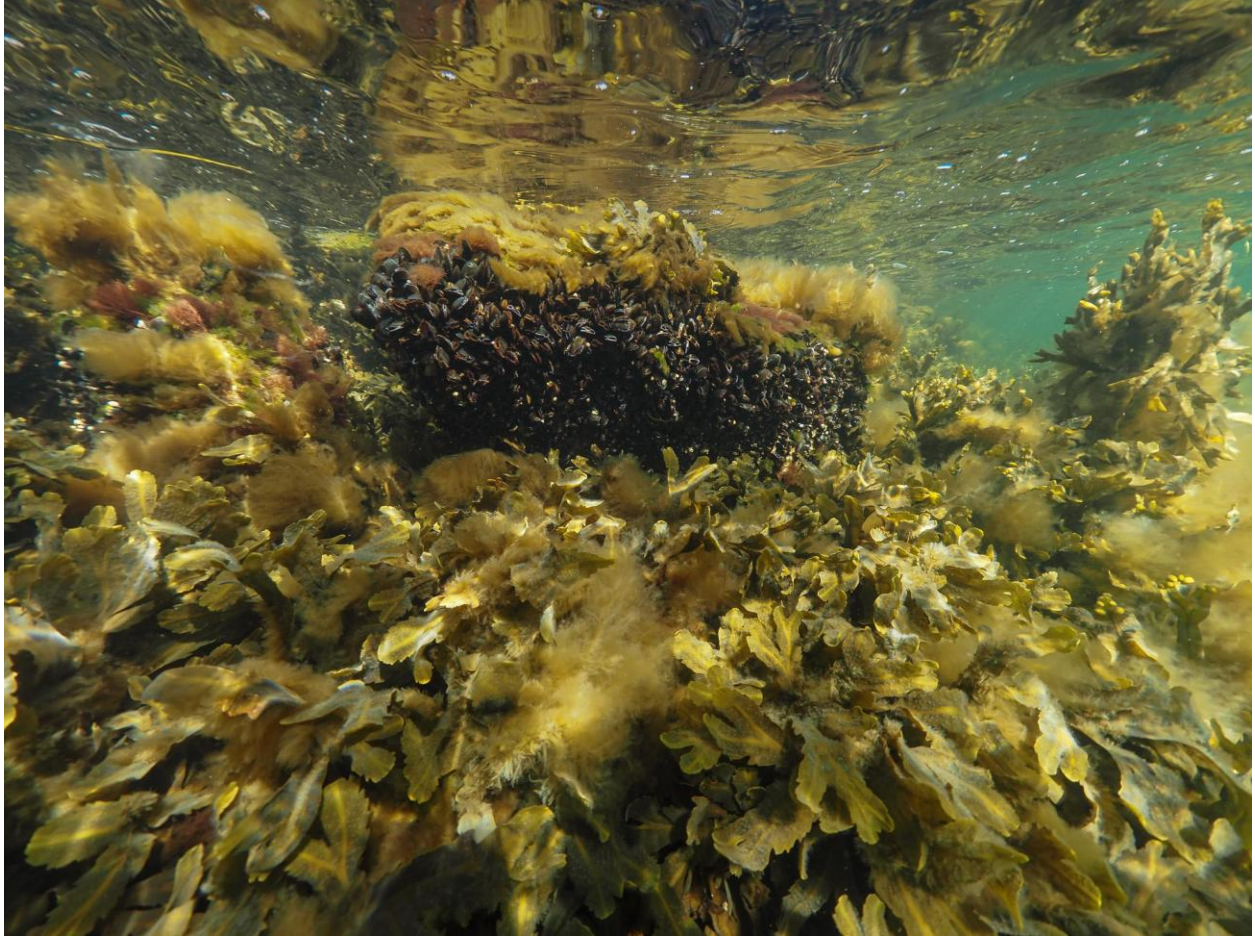
Figur 10 – Tæt dække af sav- og blæretang, samt blåmuslinger på stensætningen ved Station 4 ved Fase 1. Taget på 0-1 meters dybde.