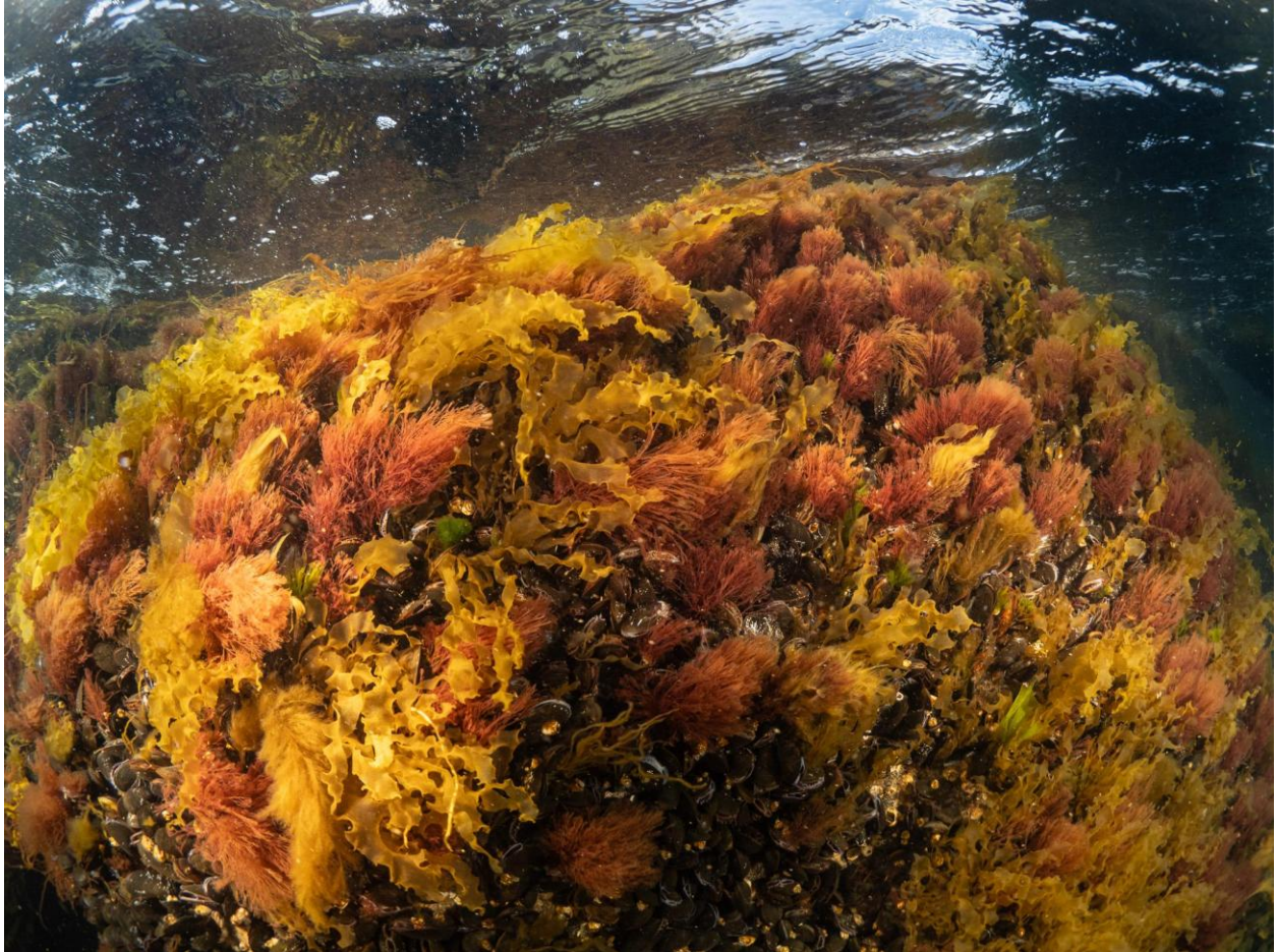
Figur 7 – Bevoksning af alger og blåmuslinger påstensætningen ved Station 3 ved Fase 1. Taget på 0-1 meters dybde.

I alt blev der set 34 arter på Station 3, og den er dermed den mest artsrige station i biodiversitetskortlægningen også set i forhold til de to referencestationer ved Trekrøner Fortet.