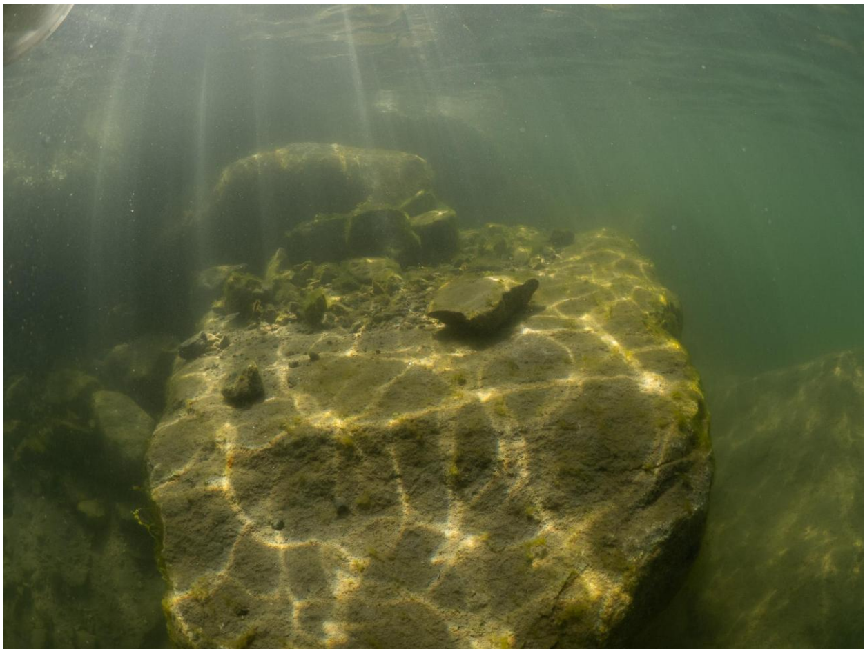
Figur 2 - Nylagt sten ved Station 1 ved Fase 2 med tyndt lag af sediment. Taget på 2 meters dybde.

På grund af dårlig sigt blev der kun dykket fra 0-3 meter.